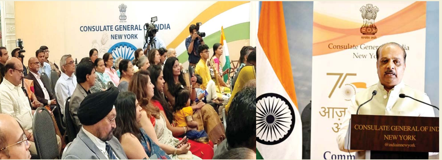
न्युयॉर्क कॉन्सुलेट जनरल कार्यालयातील बैठकीत उपस्थित विविध मान्यवर