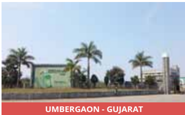
UMBERGAON - GUJARAT

This Industrial Park in the town of Umbergaon in South Gujarat was designed and developed to provide newly built and infrastructure-ready industrial plots for factories, warehouses, workshops, service stations, etc. This park is set upright on state highway 5 connects to the major national highway 8 and other highways and is just a few kilometers from the Umbergaon Road Railway station offering excellent road and rail connectivity.