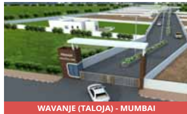
WAVANJE (TALOJA) - MUMBAI

Vavanje is a developing node, for all industrialists, Manufacturers, and warehousing companies, the leaders have preferred to travel all the way to locations like Talaja. Navi Mumbai International Airport is a greenfield international airport located at Panvel/Uran, It will be the extension to the existing Chhatrapati Shivaji Maharaj International Airport as India's first urban multi-airport system.