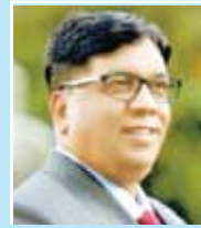
श्रीधर व्यवहारे विश्वस्त