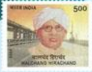
Sheth Walchand Hirachand Patriot & Pioneer of Swadeshi Car, Aircraft Mfg. & Shipping in India