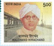
Sheth Walchand Hirachand Patriot & Pioneer of Swadeshi Car, Aircraft Mfg. & Shipping in India